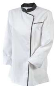
Blanc - Anthracite