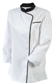
Blanc - Noir