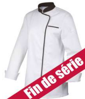
Blanc - Moka